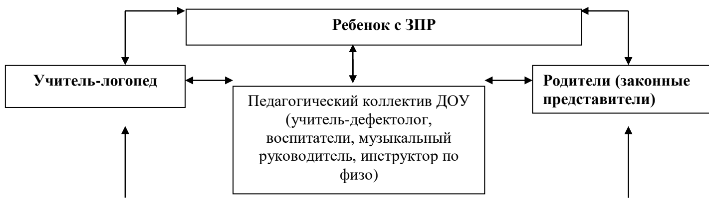
Рис.1. Модель взаимодействия субъектов коррекционно-образовательного процесса.

Линии интеграции и координации деятельности специалистов и воспитателей ДОО в работе с детьми с ЗПР прослеживаются через интеграцию образовательных областей. В работе по образовательным областям («Познавательное развитие», «Социально-коммуникативное развитие», «Художественно-эстетическое развитие», «Физическое развитие») при ведущей роли других специалистов (воспитателей, музыкального руководителя, инструктора по физической культуре) учитель-логопед является консультантом и помощником. Он помогает педагогам выбирать адекватные методы и приемы работы с учетом индивидуальных особенностей и возможностей речевого развития каждого ребенка с нарушениями речи и этапа коррекционной работы.